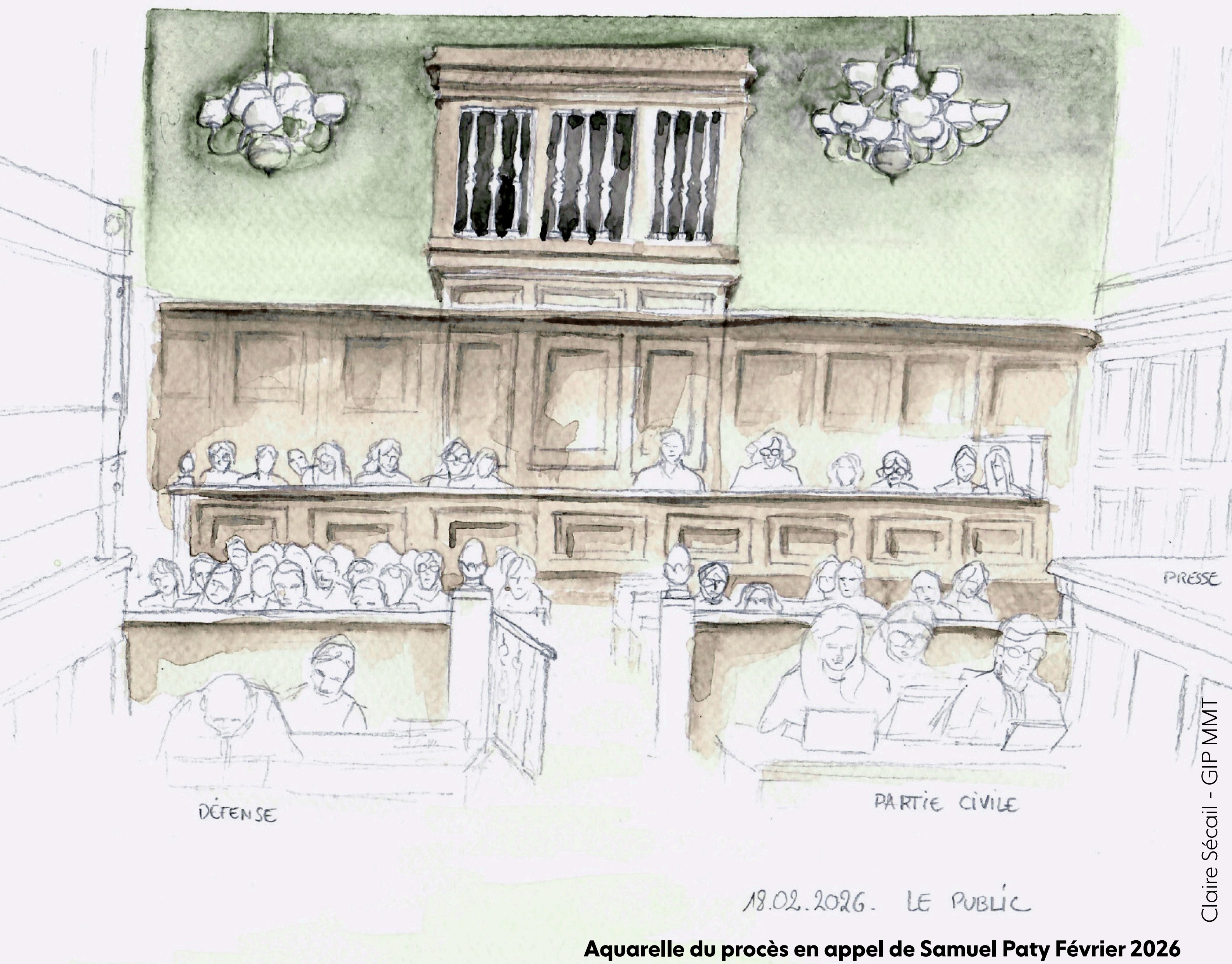
Aquarelle du procès en appel de Samuel Paty Février 2026

Cité scolaire Gabriel Fauré, 81 avenue de Choisy, 75013